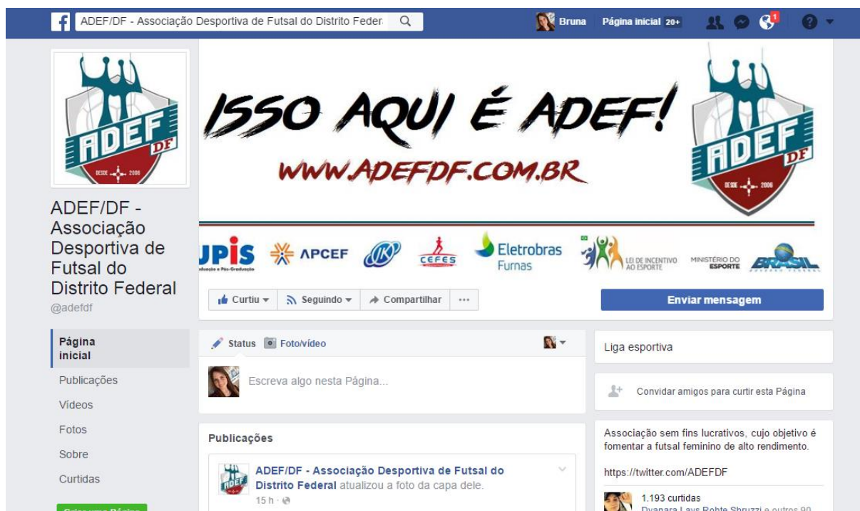
Figura 7 – Facebook da ADEF

Associação Desportiva de Futsal – DF SMPW Quadra 05 Conj. 03 Chac. 06 Casa 16 (61) 98224-2213 / 98224-2214 www.edefdf.com.br