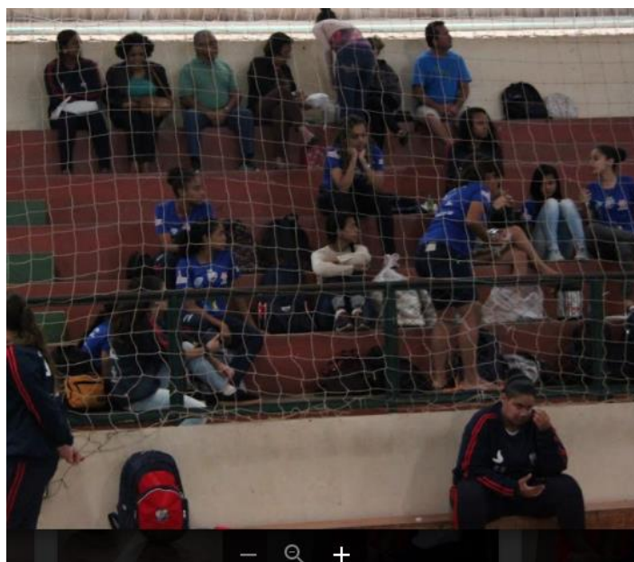
Figura 3 – Jogos da Federação de Futsal