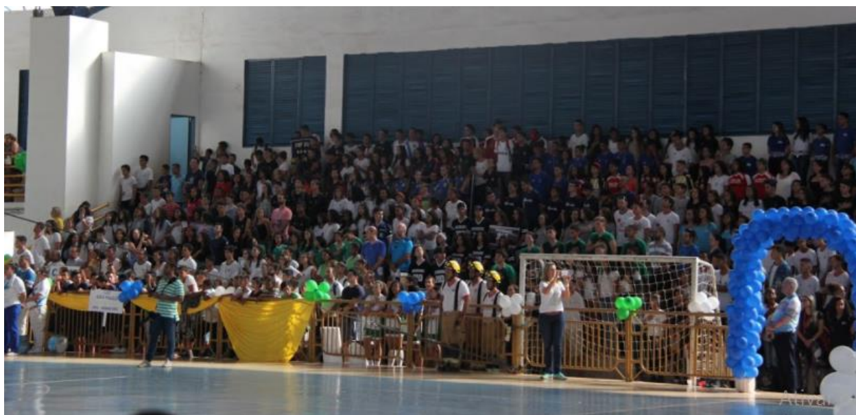
Figura 1 – Abertura dos Jogos Escolares

Ainda estamos longe do ideal desejável, mas conseguimos alcançar algumas vitórias em 2017, através da mobilização de familiares e amigos dos beneficiários diretos do projeto, conseguimos aumentar o público nos jogos da Associação conforme fotos abaixo: