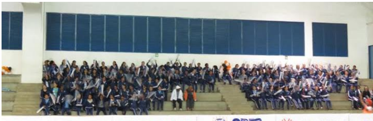
Figura 4 – Jogos da Federação de Futsal

Fica claro que obtivemos sucesso em alguns jogos, mas ainda é necessário trabalhar com o apelo popular para manter o público em todos os jogos de Futsal Feminino.